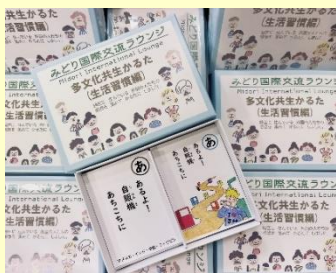
かるた生活習慣編