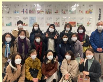
区役所ロビーで展示