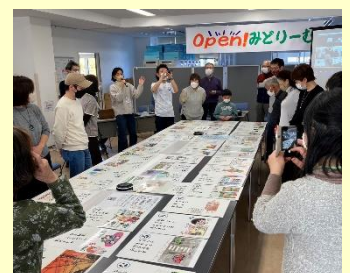
open みどりーむで交流

外国人に日本の習慣を理解してもらうだけでなく、日本人にも相手の文化習慣を理解してもらおう！ という思いで、地域に住む外国人から、来日して「おどろいたこと」「こまったこと」「どうして？」などの感想を集めてかるたを作りました。集まった感想は169件!! そこから46枚の読み札と絵札ができました。外国人がなぜそう感じるのか、日本人はなぜそうするのか…地域の方々との意見交換や交流のきっかけにかるたをぜひご活用ください。かるたは、ラウンジのHPからダウンロードできます。 https://midori-lounge.com/?page_id=1599