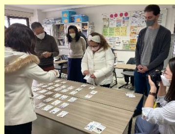
新聞取材を受けました