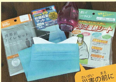
さいがい 災害の前に じゅんび 準備しましょう