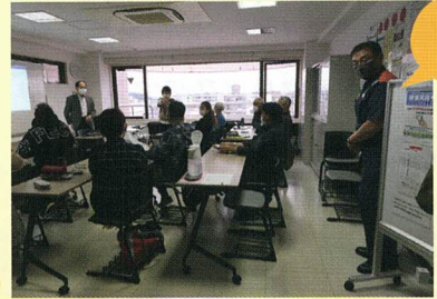
しょうぼうし 消防士さん