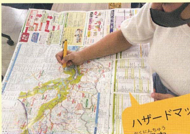
ハザードマップで まくにちゆう 確認中