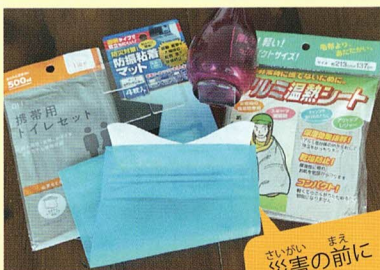
さいがい 災害の前に まへ 準備しましょう